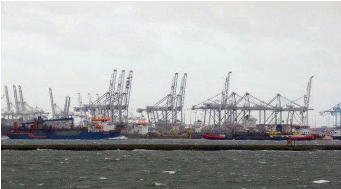
名古屋港 Nagoya Port

10月26日(金) 午後 12:00 までに 必ず留学生支援室へ連絡してください。 Please let us know by 12:00 p.m., Friday, October 26 th .