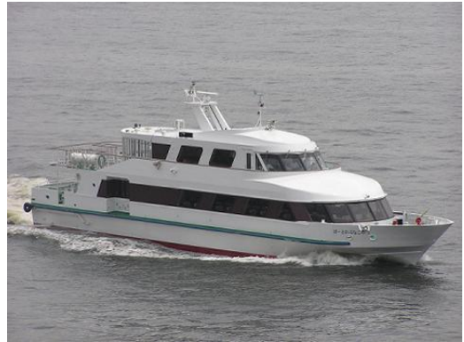
港務艇 Port Tour Boat

※1977 年以来、愛知県の製造品出荷額等は、連続して全国 1 位の実績を誇っています。愛知(中部)のモノづくりを物流面で支えている名古屋港を、港務艇に乗って見学します。